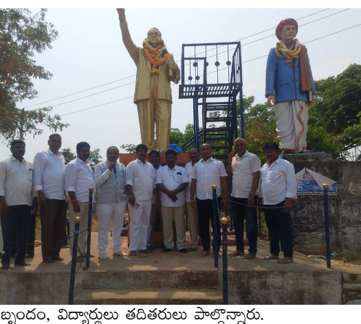
బృందం, విద్యార్థులు తదితరులు పాల్గొన్నారు.