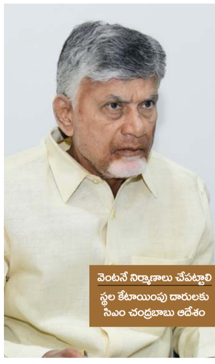
వెంటనే నిర్మాణాలు చేపట్టాలి స్థల కేటాయింపు దారులకు సీఎం చంద్రబాబు ఆదేశం

భద్రాచలం ఇవో రమాదేవిపై ఎపిలో దాడి పురుషోత్తమపట్నం భూ ఆక్రమణదారుల ముష్కర దాడి హుటాహుటిన ఆస్పత్రికి తరలింపు