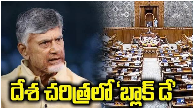
దేశ చరిత్రలో 'బ్లాక్ డే'

తుర్కగోదావరి, ఏప్రిల్ 18: పార్లమెంట్లో మహిళా రిజర్వేషన్ బిల్లును ప్రతిపక్షాలు అడ్డుకోవడంపై ముఖ్యమంత్రి చంద్రబాబు నాయుడు స్పందించారు. శనివారం మీడియాతో మాట్లాడుతూ.. పార్లమెంట్లో జాతికి విద్రోహం చేశారు.. మహిళలకు అన్యాయం జరిగిందన్నారు. పార్లమెంట్లో మహిళల 33 శాతం రిజర్వేషన్ బిల్లును అడ్డుకున్న రోజు దేశ చరిత్రలో 'బ్లాక్ డే' అంటూ