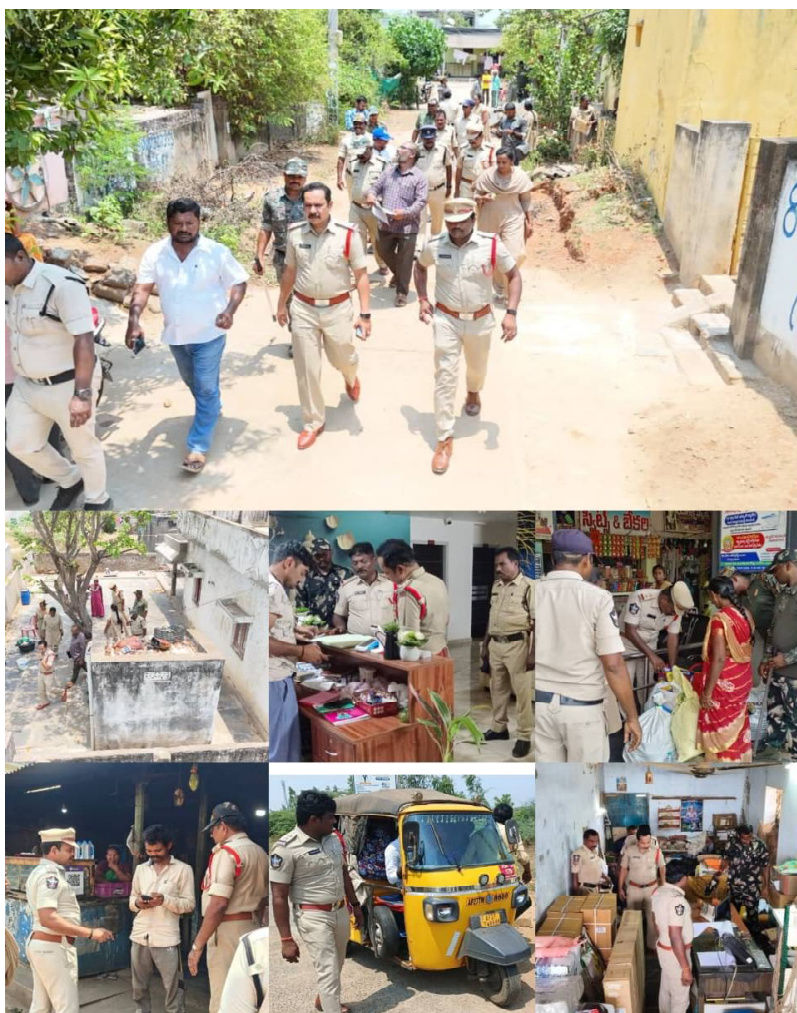
చేశారు. సాధ్యమైనంత వరకు అందరూ కూడా సీసీ కెమెరాలు ఏర్పాటు చేసుకోవాలి అని ప్రజలకు తెలియజేసినారు....