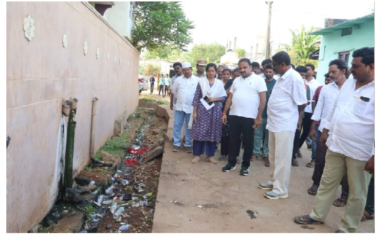
బంకులను వెను వెంటనే తొలగించేలా కార్యచరణకు సిద్ధం కావాలని ఇట్లు బంకుల నిర్వాహకులకు అటు పురపాలకులకు సూచించారు. అవసరమైన చోట నూతన మురికి కాలువల నిర్మాణానికి ఉపక్రమించాలని ఆయన ఆదేశించారు.

క్రై కౌంటర్ ప్రతినిధి టి నాగ బ్రహ్మం కందుకూరు రూరల్, పట్టణంలోని 13వ వార్డులో ఉన్న బండపాలెం, రామ్ నగర్, ఆనందపురం రోడ్డు, 14- 16 , వార్డుల్లోని పలు డ్రైనేజీ కాలువలను ఎమ్మెల్యే ఇంటూరి నాగేశ్వరరావు గురువారం ఉదయం క్షుణ్ణంగా పరిశీలించారు. ఈ సందర్భంగా ఆయన పడకేసిన పారిశుధ్యం పై మున్సిపల్ బాధ్యులను నిలదీశారు. వారి కార్యశీలతపై అసహనాన్ని వ్యక్తం చేశారు. మీ ప్రవర్తన మార్చుకోండి!.. మీరే చిన్నపిల్లలు కాదు, పదేపదే చెప్పించుకోవడానికి, అని ఆయన వారిని సున్నితంగా మందలించారు. మురుగు కాలువలు 10 రోజులకు ఒకసారి క్లీన్ చేయాలని సిబ్బందికి సూచించారు. కొన్ని ప్రదేశాలలో కాలువలు రెండు నెలలైనా క్లీన్ చేయడం లేదని ఆయన దృష్టికి స్థానికులు సమస్యను తీసుకురాగా, దీనిపై స్పందిస్తూ, మురికి కాలువల్లో మురుగు గడ్డ కట్టి ప్రవాహ రహితంగా ఉన్నాయంటే, ఇవి తీసి రెండు నెలలు అయి ఉంటుందని మున్సిపల్ బాధ్యులను ప్రశ్నించగా, వారు ఈ మధ్యే కాలువలను క్లీన్ చేశామని బుకాయించడంతో, నేనేమి ఆమెరికా నుండి రాలేదు! నేను క నిర్మాణరంగంలోనే ఉన్నాను అని ఆయనమున్సిపల్ అధికారులకు చురక లలిచ్చారు. కాలువలు ఆక్రమించి, బంకులు పెట్టి వ్యాపారం చేస్తున్న స్థానికులను బంకులు తొలగించాలని, కాలువల సక్రమ నిర్వహణకు అడ్డంకులుగా ఉన్న