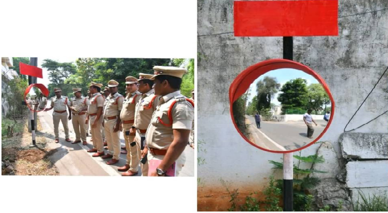
క్రైం కౌంటర్ స్టాఫ్...మార్కాపురం జిల్లా... ప్రకాశం మరియు మార్కాపురం జిల్లాలో రోడ్డు ప్రమాదాల నివారణకు పోలీసుల ముందడుగు బ్లాక్ స్పాట్లు, గ్రామాల నుంచి నేషనల్ హైవేకు కలిసే జంక్షన్లు, ప్రమాదకర మలుపుల్లో