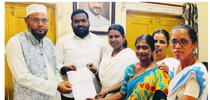
వాస్తవం : జైపూర్

జైపూర్ మండలం లోని కుందరం పి హెచ్ సి పరిధిలోని శివ్వరం పొసూర్ వేలాల కుందరం సెట్ పెళ్లి టేకుమట్ల ఇందారం బెజ్జల గ్రామాలలో పని చేసే ఆశ వర్షం తమ సమస్యలు ప్రభుత్వ దృష్టికి తీసుకువెళ్లాలని గ్రామ సర్పంచులకు వినతి పత్రాలు సమర్పించారు చాలీచాలని వేతనాలతో పనిచేస్తున్నామని కాంగ్రెస్ గవర్నమెంట్ మేనిఫెస్టోలో పెట్టిన విధంగా తమకు 18 వేల ఫిక్స్డ్ వేతనం ఉద్యోగ భద్రత కల్పించి తమకు న్యాయం చేసి సమస్యలు పరిష్కరించాలని మీ ద్వారానైనా మా సమస్యలను స్థానిక మంత్రి డాక్టర్ వివేక్ వెంకటస్వామికి, సీఎం రేపంత్ రెడ్డికి ఆరోగ్య శాఖ మంత్రి రాజ నరసింహాకి మా వినతులు చేరవేసి మీరైనా మాకు న్యాయం చేయాలని సర్పంచులకు వినతి పత్రాలు సమర్పించారు.