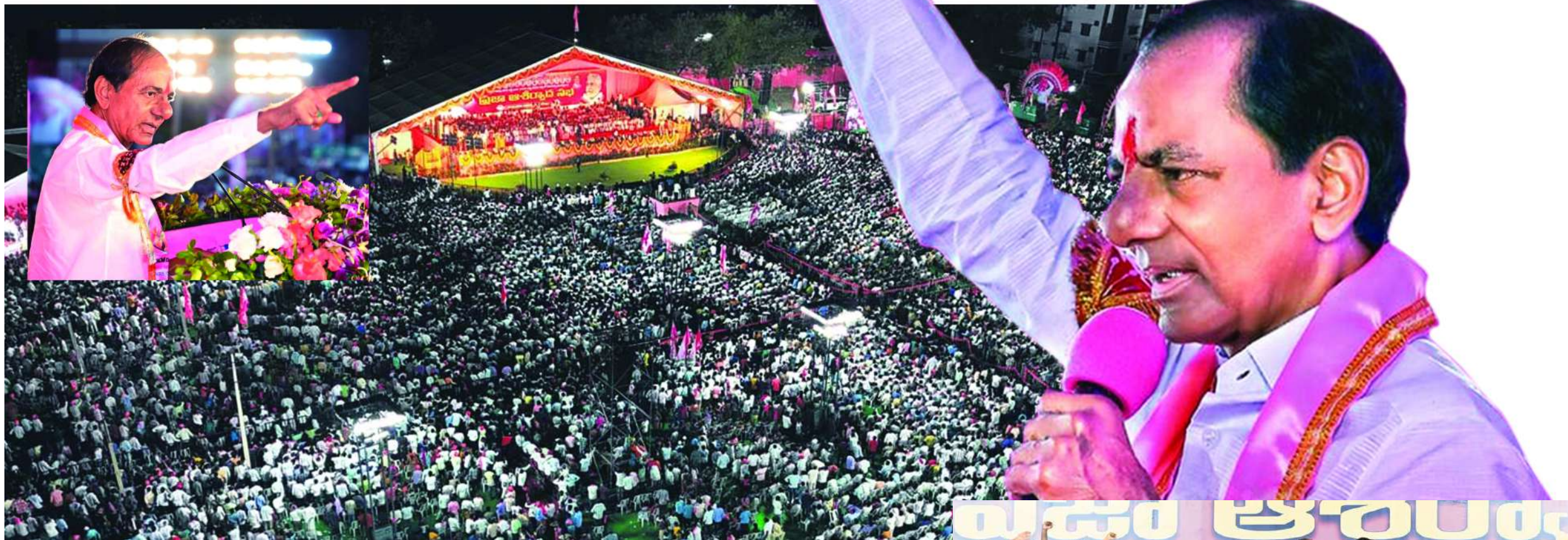
తెలంగాణ పునర్విద్యుత్తు కోసం బీఆర్ఎస్ లో చేరారు