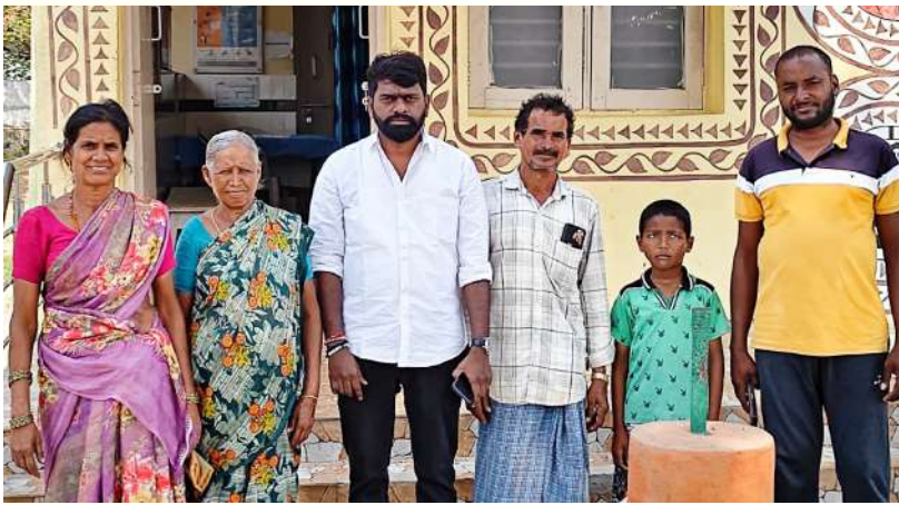
వాస్తవం : తిరుమలగిరి