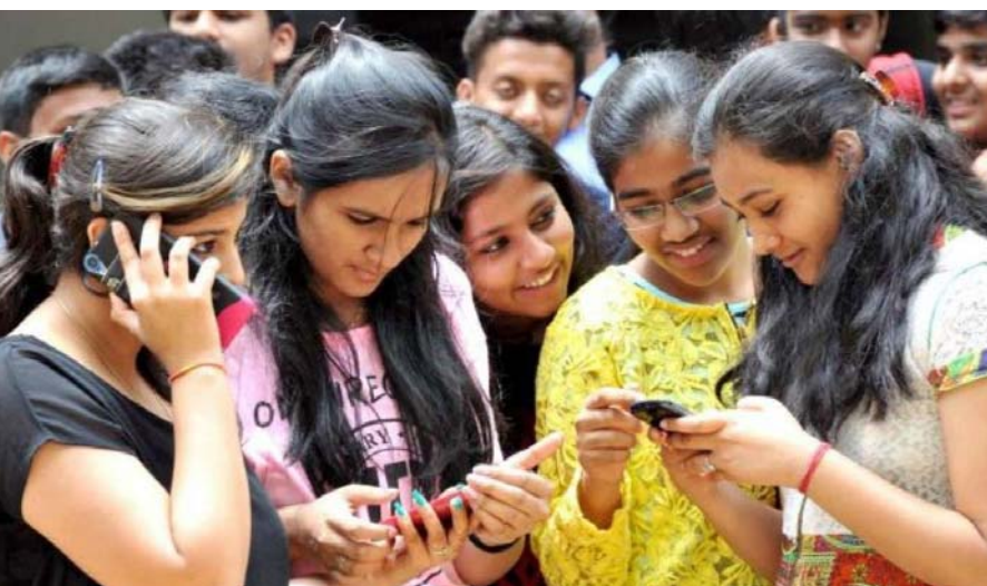
తెలిపారు. అకడమిక్ విల్స్ కోసం అందరూ కలిసి ఫలితాల్లో అభ్యులు కంటే అభ్యులు మెరుగైన ఫలితాలు సాధించారు. ఇంటర్ ఫలితాలు సాధించారు. ద్వితీయ సంవత్సరం

అమరావతి, ఏప్రిల్ 15 (ఆర్ఎన్ఎ): ఏపీ ఇంటర్ ఫలితాలు విడుదలయ్యాయి. బుధవారం ఉదయం మంత్రి నారా లోకేశ్ ఫలితాలను విడుదల చేశారు. ఈ ఏడాది ఇంటర్ ఫలితాల్లో రికార్డు స్థాయిలో ఉత్తీర్ణత సాధించినట్లు అయ్యింది. గత 12 ఏళ్లలో అత్యధికంగా మొదటి సంవత్సరం విద్యార్థులు 77 శాతం పాస్ అయ్యారు. రెండో సంవత్సరం విద్యార్థులు 81 శాతం పాస్ అయ్యారు. రెండో అత్యున్నత ఫలితాలను సాధించారు. విద్యార్థులు తమ ఫలితాలను వెబ్ సైట్లో చూసుకోవచ్చు. మెసేజ్ నంబర్ 9552300009 నంబర్ కు వాట్సాప్లో పంపితే కూడా ఫలితాలు అందుబాటులో ఉంటాయి. ప్రభుత్వ ప్రభుత్వ అధీన కళాశాలల్లో ఈ ఏడాది మెరుగైన ఫలితాలు వచ్చాయి. గవర్నమెంట్ జూనియర్ కాలేజీల్లో మొదటి సంవత్సరం 54 శాతం ఉత్తీర్ణత సాధించింది. రెండో సంవత్సరం జీజీసీల్లో 68 శాతం పాస్ అయ్యారు. ఇది గత 12 ఏళ్లలో అత్యధిక ఉత్తీర్ణతగా సమాధు అయింది. విద్యార్థులు, ట్రైనింగ్స్, లెక్చర్లలో సమిష్టి కృషి వల్లే ఈ ఫలితాలు వచ్చాయని అధికారులు