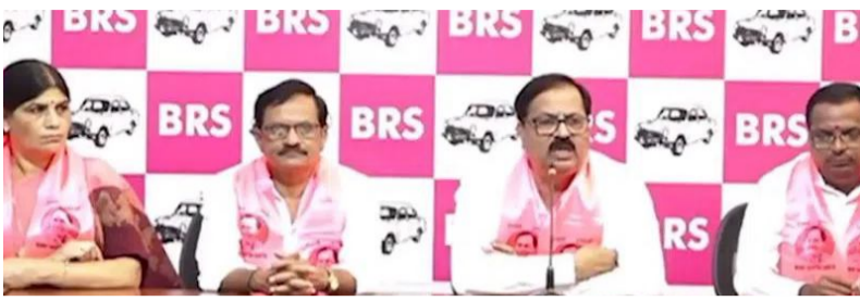
శాఖలో కమీషనర్ వేధింపులు తట్టుకోలేక తెలంగాణ ఉద్యోగి ఆత్మహత్యాయత్నం చేశారని డిమాండ్ చేశారు. తెలంగాణ సమాచారం ఉద్యోగుల్లో ఆంధ్రా పత్తెనం సదుస్థానం, ఎక్సైజ్ సోదర బంధం ఉందని, బీజేపీ రాజకీయంతో మహిళా రిజర్వేషన్లపై అమలు బిల్లు ఆగిపోయింది డిమాండ్ చేశారు. మహిళా బిల్లును లింక్ చేశారని వెల్లడించారు. చంద్రబాబు, రేవంత్ రెడ్డి మధ్య

వేయలేదని విమర్శించారు. ఉద్యోగులకు డిజిటల్ హెల్త్ కార్డులు ఏమయ్యాయని ప్రశ్నించారు. రిటైర్డ్ ఉద్యోగులు 86 మంది చనిపోయారని, రిటైర్డ్ ఉద్యోగులకు చావు పరిష్కారం అయిందని ఆందోళన వ్యక్తం చేశారు. ఇప్పటి వరకు ఉద్యోగులకు ఇవ్వాలని 14 వేల కోట్లు పెండింగ్ లో ఉన్నాయని తెలిపారు. రిటైర్డ్ ఉద్యోగులకు హైకోర్టు మెట్టు ఎక్కాలని పరిస్థితి వచ్చిందన్నారు. ప్రభుత్వ నిర్లక్ష్యం వల్ల చనిపోయిన రిటైర్డ్ ఉద్యోగులకు కోటి 20 లక్షల నష్ట పరిహారం ఇవ్వాలని డిమాండ్ చేశారు. తెలంగాణ సమాచారం ఉద్యోగుల్లో ఆంధ్రా పత్తెనం సదుస్థానం, ఎక్సైజ్