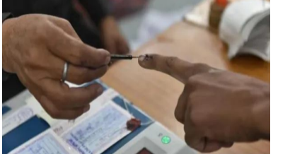
నిలిచిపోయింది. ఆ తర్వాత హైకోర్టు అనుమతితో గ్రామ పంచాయతీలు, పురపాలక సంఘాలకు ఎన్నికలను విజయవంతంగా నిర్వహించారు. రిజర్వేషన్ల విధానం ప్రకటించిన అనంతరం, హైకోర్టు అనుమతితో మే నెలలో ఎంపీటీసీ, జడ్పీటీసీ ఎన్నికలు నిర్వహించాలని ప్రభుత్వం యోచిస్తున్నట్లు సమాచారం. కాగా ఎన్ఈసీ ఆదేశాల ప్రకారం,

హైదరాబాద్ : తెలంగాణలో జిల్లా ప్రజాపరిషత్ ప్రాదేశిక నియోజకవర్గాలు (జడ్పీటీసీ), మండల ప్రజా పరిషత్ ప్రాదేశిక నియోజకవర్గాలు (ఎంపీటీసీ) ఎన్నికలకు రంగం సిద్ధమైంది. ఈ మేరకు ఓటర్ జాబితాలను సిద్ధం చేయాలని రాష్ట్ర ఎన్నికల సంఘం (ఎన్ఈసీ) ఉత్తర్వులు జారీ చేసింది. ప్రస్తుత పరిస్థితులు అనుకూలమై మే నెలలో ఈ ఎన్నికలు జరిగే అవకాశం ఉందని భావిస్తున్నారు. దీంతో మరోవారూ రాష్ట్రంలో ఎన్నికల సగారా మోగనుందని చర్చ నడుస్తుంది. ఈ ఎన్నికలను రెండు దశల్లో నిర్వహణకు గత సెప్టెంబరు 29న నోటిఫికేషన్ విడుదల చేయగా, నామినేషన్లు కూడా మొదలయ్యాయి. అయితే, బీసీ రిజర్వేషన్లపై పిటిషన్లు విచారణ కారణంగా రాష్ట్ర హైకోర్టు అడ్డంకులు 9న ఇచ్చిన ఆదేశాల మేరకు ఈ ప్రక్రియ