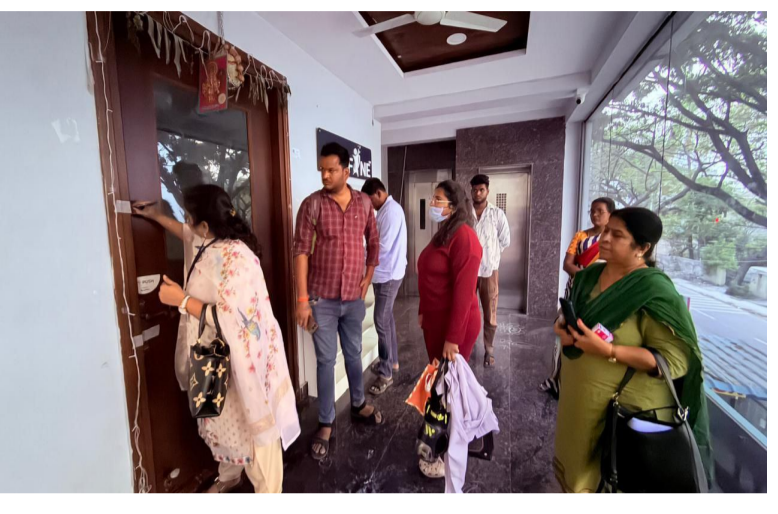
మేడ్చల్ మల్కాజ్జిరి జిల్లా మహతి న్యూస్ ప్రతినిధి :-

సఫిల్ గూడ, ఉత్తమ నగర్ ప్రాంతంలో కొనసాగుతున్న “శ్రీ వెంకటేశ్వర వెల్ నెస్ సెంటర్” పై నిర్వహించిన ఆకస్మిక తనిఖీలు పలు ఆందోళనకర అంశాలను వెలుగులోకి తీసుకువచ్చాయి.