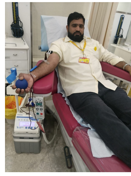
మన మహాత్మి న్యూస్ కువైట్ ఎన్ ఆర్ ఐ ప్రముఖ సేవా కార్యక్రమం నిర్వహించబడుతోంది. నారా చంద్రబాబు నాయుడు జన్మదినాన్ని