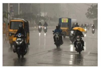
హైదరాబాద్ : తెలుగు రాష్ట్రాల్లో భిన్నమైన వాతావరణ పరిస్థితులు నెలకొన్నాయి. కొద్ది రోజులుగా ఎండ తీవ్రత పెరిగింది. గరిష్ట ఉష్ణోగ్రతలు నమోదవుతున్నాయి. ఇదే సమయంలో వాతావరణ శాఖ కీలక అప్డేట్ ఇచ్చింది. మండుతున్న ఎండల వేళ వర్షాలు కురుస్తాయని వెల్లడించింది. ఏపీ, తెలంగాణలోని పలు ప్రాంతాల్లో వర్షాలు పడే అవకాశం ఉందని వివరించింది. హైదరాబాద్ లోని పలు ప్రాంతాల్లో వర్షం కురుస్తోంది. కాగా.. నాలుగు రోజులు ఈ వర్షాలు పడే అవకాశం ఉందని పేర్కొంది. వాతావరణ శాఖ ఆంధ్రప్రదేశ్, తెలంగాణలో వాతావరణ పరిస్థితులపై కీలక అప్డేట్ ఇచ్చింది. తెలుగు

రాష్ట్రాల్లోని పలు ప్రాంతాల్లో వర్షాలు కురిసే అవకాశం ఉందని వాతావరణ శాఖ చల్లని కబురు చెప్పింది. ఉపరితల అవర్తనం కారణంగా పలు ప్రాంతాల్లో వర్షాలు కురుస్తాయని పేర్కొంది. ఉరుములతో కూడిన మెరుపులు - బలమైన గాలులు గంటకు 30-40 కిలోమీటర్ల వరకు వీచే అవకాశం ఉందని తెలిపింది. వాతావరణ శాఖ అప్డేట్ ఇచ్చింది. రోజుకు 5 రోజుల పాటు రాష్ట్రంలోని పలు ప్రాంతాల్లో తేలికపాటి నుండి మోస్తరు వర్షాలు వెల్లడించింది.