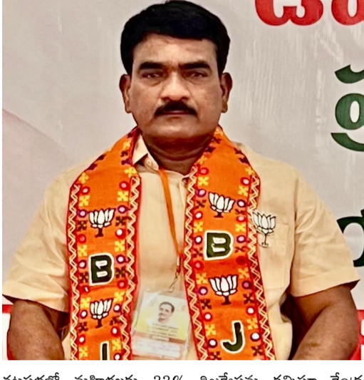
చట్టసభల్లో మహిళలకు 33% రిజర్వేషన్లు కల్పిస్తూ కేంద్ర