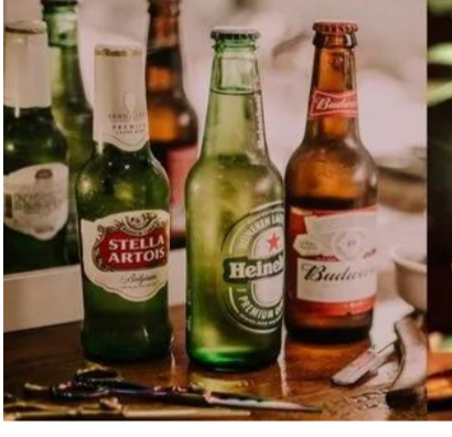
జనవరి నుంచే బీర్ల అమ్మకాల్లో పెరుగుదల కనిపించింది. నిరుడు జనవరిలో 31లక్షల కేసుల బీర్ల అమ్మకాలు జరిగాయి. ఈ జనవరిలో అవి 34 లక్షలకు పెరిగాయి. గత ఏడాది ఫిబ్రవరిలో 28లక్షల కేసులు మాత్రమే అమ్ముడయ్యాయి. ఈ సారి ఏకంగా 38లక్షల కేసుల బీర్ల విక్రయాలు జరిగాయి. ఎండలు ముదురుతుండటంతో ఫిబ్రవరి చివరి వారం

హైదరాబాద్ : వేసవి తీవ్రత పెరుగుతోంది. మద్యం అమ్మకాల్లో బీర్లకు డిమాండ్ అదే స్థాయిలో ఉంది. కొద్ది రోజులు లుకా బీర్ స్పెషల్ రికార్డు స్థాయిలో సాగుతున్నాయి. ఈ ఏడాది మార్కెట్ బీర్ విక్రయాలు 22 శాతం మేర పెరిగాయి. నిరుడు మార్కెట్ 39లక్షల బీర్ కేసులు అమ్ముడుపోగా.. ఈ మార్కెట్ రికార్డు స్థాయిలో 50.78లక్షల కేసులు అమ్ముడయ్యాయి. గత ఐదేళ్లలో ఇవే అత్యధికం. కాగా.. వచ్చే నెలలో బీర్లకు కొరత ఏర్పడే అవకాశం ఉందనే వాదన వినిపిస్తోంది. వేసవిలో బీర్ల అమ్మకాలు గణనీయంగా పెరుగుతున్నాయి. కొత్త రికార్డులు నెలకొల్పుతున్నాయి. ఈ నెలలో ఇప్పటి వరకు 21లక్షల కేసుల విక్రయాలు జరగడం గమనార్వం. ప్రస్తుతం రోజుకు సగటున 1.70 లక్షల నుంచి 1.80లక్షల వరకు బీర్ కేసులు అమ్ముడుపోతున్నాయి.