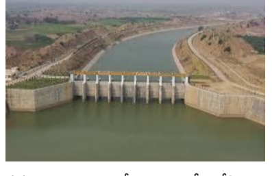
సమర్పించాలని ఆదేశాలు జారీ చేసింది. ప్రతిరోజూ సాయంత్రం 5 గంటలకు రిపోర్ట్ ఇవ్వాలని ఆదేశించింది. సీడబ్ల్యూసీ ఎన్టీఎస్ఎ అనుమతులతో పనులు, డిజైనింగ్ పునరుద్ధరణ పనులకు ప్రాధాన్యం ఇవ్వాలని నిర్ణయించింది. రోజువారీ యాక్టివ్ ప్లాన్ తో పనులు చేపట్టాలని తెలంగాణ ప్రభుత్వం సందర్భిత అధికారులను ఆదేశించింది.

హైదరాబాద్, ఏప్రిల్ 17 : కాశీశ్వరం ప్రాజెక్ట్ లిఫ్ట్ పై తెలంగాణ ప్రభుత్వం కేలక నిర్ణయం తీసుకుంది. మేడిగడ్డ, సుందర్, అన్నారం బ్యా రేజీల పునరుద్ధరణకు కమిటీ ఏర్పాటు చేస్తూ ప్రభుత్వం ఉత్తర్వులు జారీ చేసింది. ఈ మేరకు జనీటీ. పరిసిట్ మెట్రో ఆధ్వర్యంలో ఏర్పాటు చేసింది. ఇంజనీర్లు, నిపుణులతో ప్రత్యేక బృందాన్ని ఏర్పాటు చేసింది. మూడు బ్యా రేజీల మరమ్మత్తులకు సమస్యలను కమిటీ ఏర్పాటు చేసింది. కాశీశ్వరం ప్రాజెక్ట్ లిఫ్ట్ పనులు వేగవంతం చేసేందుకు ప్రభుత్వం ఆదేశాలు జారీ చేసింది. మాన్యువల్ ముందే జయో టెక్నికల్ పరిశీలనలు ఫూర్తి చేయాలని తెలంగాణ సర్కార్ సూచించింది. మే 30వ తేదీలోగా పరిశీలనలు ఫూర్తిచేయాలని డెడ్లైన్ విధించింది. రోజువారీ ఫుల్ గతి నివేదికలు ఆదేశించింది.