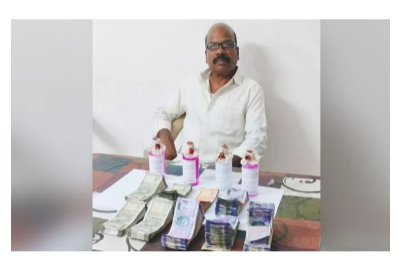
నిజామాబాద్ : కామారెడ్డి జిల్లా బిచ్చం అక్రమ సీబి సభ్యులను అరెస్టు చేసి బిచ్చం అధికారులకు ఫిర్యాదు చేయడంతో సీబి ఇంటిపై దాడి చేసి పట్టుకున్నారు. అదేవిధంగా అతని వద్ద అదనంగా లభించిన రూ.45, 67 0లను స్వాధీనం చేసుకుని స్టేట్స్ పీసీబి అధికారులు దాడులు చేశారు. బిచ్చం అక్రమ సీబి ఇంట్లో ఉంటున్న సీబి బాధితుడి నుంచి రూ.2

లక్షలు తీసుకుంటుండగా ఏసీబి అధికారులు రెడ్ హ్యాండెడ్ గా పట్టుకున్నారు. కల్లు దుకాణం మరో గ్రామానికి తరలింపును అనుమతించి, కేసులు నమోదు చేయవద్దని కోరగా ప్రతిఫలంగా ఎక్సైజ్ సీబి దీని సభ్యులను అరెస్టు చేసి 490 మందిని అరెస్టు చేశారు. దీంతో బాధితుడు ఏసీబి అధికారులకు ఫిర్యాదు చేయడంతో సీబి ఇంటిపై దాడి చేసి పట్టుకున్నారు. అదేవిధంగా అతని వద్ద అదనంగా లభించిన రూ.45, 67 0లను స్వాధీనం చేసుకుని స్టేట్స్ పీసీబి అధికారులు దాడులు చేశారు. బిచ్చం అక్రమ సీబి ఇంట్లో ఉంటున్న సీబి బాధితుడి నుంచి రూ.2