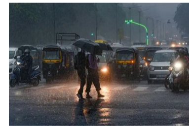
దవుతున్నాయి. 45 డిగ్రీల వరకు గరిష్ట ఉష్ణోగ్రతలు నమో దవుతుండటంతో ప్రజలు అల్లాడిపోతున్నారు. ఎండ వేడితో పాటు వడగాల్లులు, ఉక్కుబోతతో జనాలు

హైదరాబాద్ : భానుడి భగభగల వేక బిగ్ లిఫ్ట్ రాష్ట్ర ప్రజల అల్లాడిపోతున్నారు. ఉదయం నుంచే ఉష్ణోగ్రతలు ఒక్కసారిగా పెరుగుతున్నాయి. చాలా చోట్ల 40 డిగ్రీలకు పైగా ఉష్ణోగ్రతలు నమోదవుతుండగా... జనాలు ఉక్కిరిబిక్కిరి అవుతున్నారు. ఇలాంటి పరిస్థితుల నేపథ్యంలో... వాతావరణశాఖ వచ్చే కలుగు చెప్పింది. రాష్ట్రంలో రాగల 4 రోజులు పాటు పలు చోట్ల వర్షాలు పడే అవకాశం ఉందని అంచనా వేసింది. ఈ జిల్లాలకు అల్టర్ జారీ చేసింది. తెలుగు రాష్ట్రాల్లో భానుడు తీవ్ర రూపం దాల్చు తున్నారు. రెండు రాష్ట్రాల్లో రికార్డు స్థాయిలో ఉష్ణోగ్రతలు నమో