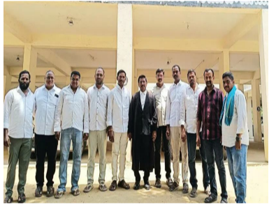
నిజామాబాద్ : రైతులందరికీ రుణమాఫీ చేయాలని ప్రభుత్వాన్ని నిలదీసినందుకు నిజామాబాద్ జిల్లా కమ్యూనిటీ బీఆర్ఎస్ నాయకులను, రైతులపై అక్రమ కేసులు పెట్టి రెండేండ్లుగా కోర్టుల చుట్టూ తిప్పుతుండడం ఉంగ్రెస్ ప్రభుత్వ నిరంకుశ శత్యానికి నిదర్శనమని మాజీ మంత్రి, ఎమ్మెల్యే వేముల ప్రకాష్ రెడ్డి అన్నారు. ఈ సందర్భంగా ముఖ్యమంత్రి రేపంత్ రెడ్డి వైఖరిని తీవ్రంగా

ఖండించారు. బాల్కొండ నియోజకవర్గంలో 52,000 మంది రైతులకు రుణమాఫీ కావాల్సి ఉండగా కేవలం 22,000 మంది రైతులకు రుణమాఫీ చేసి ఇంకా 30,000 మంది రైతులకు రుణమాఫీ కాలేదని అన్నారు. వీటిపై ప్రభుత్వాన్ని నిలదీసినందుకు కేసులు పెట్టి శుక్రవారం ఆర్డర్ కోర్టులో కేసు హియరంగ్ కు హాజరైన బీఆర్ఎస్ నాయకులు, రైతులు తమకు న్యాయం చేయాలని, ప్రభుత్వం వెంటనే ఫూర్తి స్థాయిలో రుణమాఫీ అమలు చేయాలని డిమాండ్ చేయడం సమంజసమని ఆయన పేర్కొన్నారు. ఎన్నికల సమయంలో ఇచ్చిన హామీలను నిలబెట్టుకోవడం ప్రభుత్వ బాధ్యత అని స్పష్టం చేశారు. తక్షణమే ప్రభుత్వం స్పందించి రైతులపై ఉన్న కేసులను ఉపసంహరించుకోవాలని, ఫూర్తి స్థాయిలో రుణమాఫీ అమలు చేయాలని రైతులను ఇబ్బందులకు గురిచేసే నిధానాలను నిలిపివేయాలని ప్రభుత్వాన్ని వేముల డిమాండ్ చేశారు.