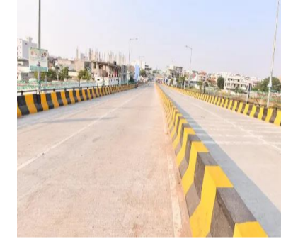
వల్ల అయిదు నిమిషాల్లో గమ్యాన్ని చేరుకోవచ్చు. మైలార్డెవ్ లో నుండి వట్టిపల్లి మీదుగా ఫలక్ నుమా ఆర్డీబీ బస్ డిపోకు వెళ్లే

మైలార్డెవ్ లో నుండి ఫలక్ నుమా ఆర్డీబీ డిపో వరకు గల దూరాన్ని అనుసరించి దానించూడానికి ఈ బ్రిడ్జి నిర్మాణాన్ని చేపట్టింది. తాజాగా మంత్రి శ్రీధర్ బాబు దీన్ని ప్రారంభించారు. ఈ ఆర్డీబీ వల్ల బిబి కావచ్చు, ఫలక్ నుమా, వట్టిపల్లి, శాస్త్రపురం, తీగలకుంట, నవాబ్ సాహెబ్ కుంట (శంషాబాద్ వైపు), కాబీడాన్, అరంఘర్ వంటి పరిసర ప్రాంతాల ప్రజలకు గణనీయమైన ప్రయోజనం చేకూరుతుంది. బండ్లగూడ రోడ్డుకు చేరుకోవడానికి నేపథ్యంలో ఐటీఐ అకాడమీ, శివరంపల్లి లేదా ఫలక్ నుమా-చంద్రాయణగుట్ట మార్గం గుండా గతంలో నాలుగు కిలోమీటర్ల అసవసరమైన ప్రయాణం ఉండేది. ఇప్పుడు ఈ ఆర్డీబీతో