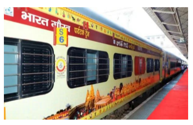
సికింద్రాబాద్ నుండి ఈ భారత్ గౌరవ్ ఎక్స్ ప్రెస్ బయలుదేరి వెళ్తుంది. మొత్తం 702 సీట్లు అందుబాటులో ఉంటాయి. ఇందులో స్టీవర్- 160, 3వీ- 490, 2వీ- 52, సికింద్రాబాద్ నుంచి బయలుదేరే ఈ ఎక్స్ ప్రెస్

హైదరాబాద్ : సికింద్రాబాద్ నుంచి అయోధ్య-వారణాశి- బైర్హాన్ ధామ్ పుణ్యక్షేత్ర పేరుతో ఇండియన్ రైల్వే క్యాంపింగ్ అండ్ లూరింగ్ కార్పొరేషన్ మరో టూర్ ప్యాకేజీని ప్రకటించింది. ఫూరీ- బైర్హాన్ ధామ్- ప్రయాగ్ రాజ్ వంటి ప్రఖ్యాత పుణ్య క్షేత్రాలు ఈ ప్యాకేజీలో ఉన్నాయి. యమున పుష్కరాలు దీనికి అదనం. యమున పుష్కరాలు సౌరస్థి రిండుకుని ప్రయాగ్ రాజ్ లో పుణ్య స్థలాలు ఆదరించే అవకాశం లభించింది. భారత్ గౌరవ్ ఎక్స్ ప్రెస్ ద్వారా అయోధ్య ప్రాంతాలను భక్తులు దర్శించుకోవచ్చు. 9 రాతలు/10 పగళ్లు సాగే యాత్రా స్పెషల్ ఇది. జూన్ 3వ తేదీన