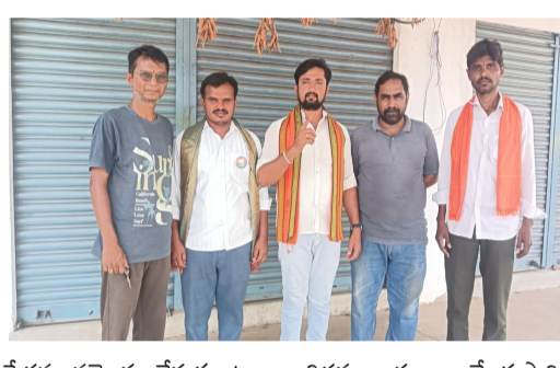
పేద్రను సమోచు చేసుకుంటూ ఇందిరమ్మ ఇల్లు రాగానే ఈసారి ఫస్ట్ నీత ఇస్సాను అని చెప్పా ఆశపేడుతున్నారు. ఇందులో అతి ముఖ్యమైన విషయం ఏమిటంటే లిస్టు వచ్చి మా ఇంటి దగ్గర్లో ఉన్నది, వచ్చి పేరు చూసుకోండి, పేరు ఉంటే ౩౩ లో ఉన్నదాన్ని ౩1 లోకి తెచ్చే బాధ్యత నాది అంటూ పుకార్లు వినిపిస్తున్నాయి. దానికి తోడు మీరు ఈసారి జరిగిన ఎలక్షన్ లో