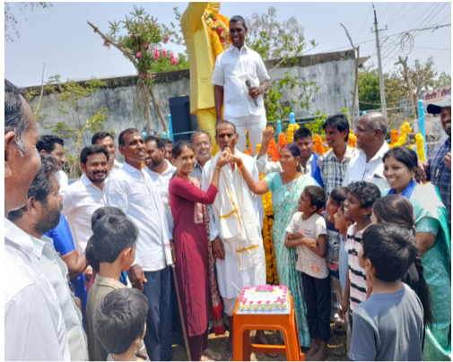
ఖమ్మం జిల్లా బ్యూరో కార్యకర్తల సమన్వయ కమిటీ 14 ఖమ్మం జిల్లా, సింగరేణి మండలం పేరుపల్లి గ్రామంలో భారత రాజ్యాంగ దాక్టర్ బాలాసాహెబ్ దాక్టర్ బీఆర్ అంబేద్కర్ గారి 135వ జయంతి వేడుకలు అత్యంత ఘనంగా,