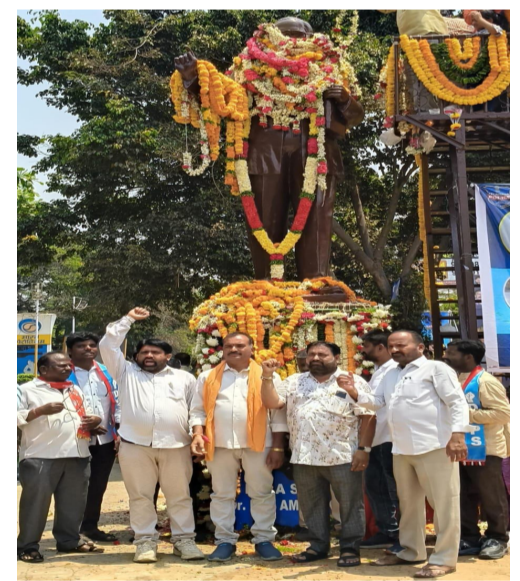
పానుమకొండ, ఏప్రిల్ 14: భారత రాజ్యాంగ నిర్మాత, భారత రత్న దాక్టర్ బాలాసాహెబ్ ఢీమరావ్ రామేజీ అంబేద్కర్ 135వ జయంతి సందర్భంగా ఆ