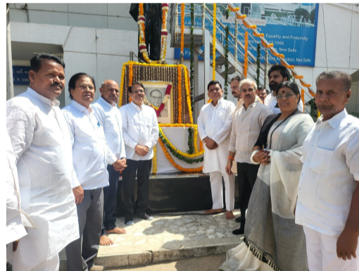
అనుసరించి సమానత్వం, సామాజిక న్యాయం, రాజ్యాధికారం సాధించేందుకు కృషి చేయాలని నాయకులు పిలుపునిచ్చారు