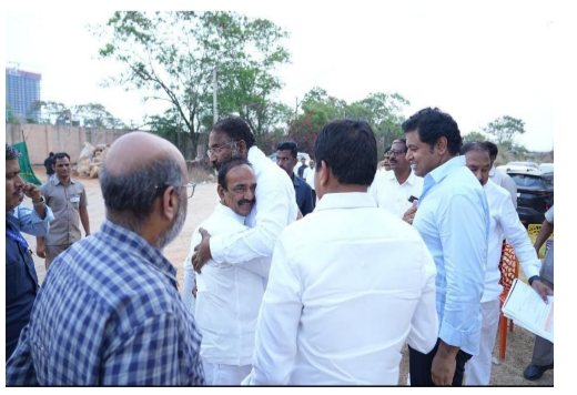
మన మహాత్మినీ ప్రతినధి కోకాపేటలో ముదిరాజుల కోసం రాష్ట్ర ప్రభుత్వం బడు ఎకలాల్లో నిర్మిస్తున్న భవనాన్ని పరిశీలించిన ముదిరాజ్ అగ్ర నాయకులు పార్టీలకు అతీతంగా ముదిరాజుల కోసం ఒకటై జై కొట్టిన ముదిరాజ్ నాయకులకోకాపేటలో

మా విధానం నినాదం ముదిరాజుల సర్వతోముఖాభివృద్ధి లక్ష్యమని చాటి అద్భుత దృక్పథం