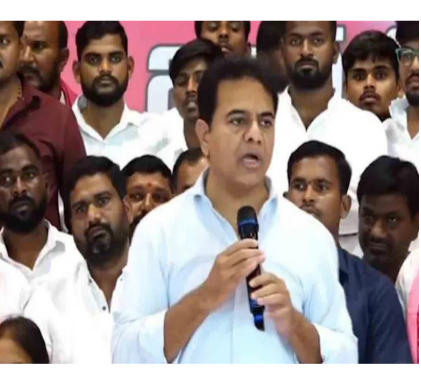
రెండు లక్షల ఉద్యోగాలని ఊరించి పెద్ద పెద్ద మాటలు చెప్పి చివరకు మోసం చేసి గద్దెనెక్కి. ఇంతవరకు రెండున్నర సంవత్సరాల్లో 11 వేల ఉద్యోగాలు కూడా ఇవ్వలేదు. మహిళలకు సూట్లు, తులం బంగారం అన్నాడు.. నెలకు రూ.2500 ఇస్తా అన్నాడు.. అత్రకు రూ.4 వేలు, కోడలుకు రెండున్నర వేలు నోటికి ఎంతోన్న అంత మాటలిచ్చి మహిళలను మోసం చేసింది. కేసీఆర్ రాకముందు 200 పెన్షన్ వచ్చేది. కేసీఆర్ దాన్ని రూ.2 వేలు చేసింది. సవంతల్లో అయితే రూ.2వేలు, డిసెంబర్లో అయితే 4 వేలు అని చెప్పింది. ముసల్లోళ్లను కూడా మోసం చేసింది. రెండు నెలలు ఇప్పటికీ పెన్షన్ ఎగ్జిజిండు. 28 నెలల్లో సాధించింది ఏమైనా ఉందంటే ఒకే ఒక్కటి ధీల్లీకి పోవచ్చు. వచ్చును.. ఎక్కే విమానం.. పోయే విమానం తప్పు ఈ రాష్ట్రంలో చేసింది మాత్రం ఏమీ లేదన్నారు.

హైదరాబాద్ : ఈ అరాచక పాలనను అంతమొందించాలంటే కొత్తతరం నాయకత్వం రావాల్సి అవసరం ఉంది. రాజీవ్ రోజుల్లో ఎన్నికలు ఎప్పుడొచ్చినా అవి కేసీఆర్ ఎన్నికలుగానే ఉంటాయి.. అసెంబ్లీ ఎన్నికలు కాదు. కేసీఆర్ ఎన్నికలే ఈ రాష్ట్రంలో జరుగుతాయని బీఆర్ఎస్ వర్కింగ్ ప్రెసిడెంట్ కేటీఆర్ స్పష్టం చేశారు. ఇలహీంపట్నం నియోజకవర్గం బీఆర్ఎస్ పార్టీ కార్యకర్తల సమావేశంలో కేటీఆర్ మాట్లాడుతూ.. కేసీఆర్ తిరిగి అధికారంలోకి వస్తే ఎన్నికలే జరుగుతాయని నాకు విశ్వాసముందన్నారు. ఇది నా ఆలోచన కాదు.. రాష్ట్రంలో ఎవరినైనా అన్నా ఎట్టున్నది పరస్పరి అని అడగండి. రైతన్నల బాధల వర్షనాశితంగా ఉన్నాయి. నేను జగిత్యాలకు పోతే అక్కడ 5 రైతు సోదరులకు కలిసింది. అన్న ఎట్టున్నది పరస్పరి అని అడిగిన. ఆ విషయం సార్ మూడు సార్లు రైతు బంధు ఎగ్జిజిండు. రూ.27 వేల కోట్లు మిగిలినాయి. అందులో నుంచి 20 వేల కోట్లు ఇచ్చి రుణమాఫీ చేసినా అని దబ్బా కొట్టుకుంటున్నాడు. మా పైనల మాకే ఇచ్చి మీదికెళ్లి బాకీ ఉన్నాడు.. కానీ బయటకు మాత్రం రైతు బంధు ఎగ్జిజిండు అని చెప్పాడు. రుణమాఫీ చేసినా అని చెప్పి.. అది కూడా ఊరిలో చారానా మండికి చేసింది. బారానా మండికి కాతేలే. అగ్గ గట్టంది పాలనా అని ఒకే ఒక్కమాటలో రైతన్న చెబుతున్నాడు. ఏ యువకుడినైనా అడగండి