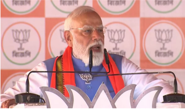
ప్రకటించారు. మహిళల భద్రతకు పూర్తి హామీ ఉంటుందని, వారు ఎప్పుడైనా, ఎక్కడైనా భయపడకుండా జీవించే వాతావరణం కల్పిస్తామని చెప్పారు. రైతుల సమస్యలపై కూడా మోదీ ప్రత్యేకంగా స్పందించారు. డీఎంసీ ప్రభుత్వం రైతులను మోసం చేసిందని ఆరోపిస్తూ, ముఖ్యంగా బంగారంపై రైతులు తీవ్ర ఇబ్బందులు ఎదుర్కొంటున్నారని అన్నారు. బీజేపీ సమయం వచ్చింది" అని వ్యాఖ్యానించారు. సీఎపి (పౌరసత్వ సవరణ చట్టం) అంశాన్ని ప్రస్తావిస్తూ, ముఠా, సమశూద్ర వంటి శరణార్థి వర్గాలకు పౌరసత్వం కల్పనను వేగవంతం చేస్తామని మోదీ హామీ ఇచ్చారు. వారు ఎవరి దయపై కాకుండా రాజ్యాంగ పరిరక్షణలో ఉన్నారని స్పష్టం చేశారు.

బంగారం : అసెంబ్లీ ఎన్నికల వేడి రోజురోజుకూ పెరుగుతోంది. ఈ నేపథ్యంలో ప్రధాని సరేంద్ర మోదీ శనివారం నిర్వహించిన భారీ బహిరంగ సభలో డీఎంసీ ప్రభుత్వంపై తీవ్ర స్థాయిలో విమర్శలు గుప్పించారు. సభకు హాజరైన వేలాది మంది ప్రజలను ఉద్దేశించి మాట్లాడిన మోదీ, ఈ భారీ జనసంద్రం మే 4న వచ్చే ఫలితాలకు టైలర్ అంటూ వ్యాఖ్యానించారు. బర్లమాన్ ప్రాంతంలో నిర్వహించిన ఈ సభలో ప్రజల ఉత్సాహం, నిబద్ధత స్పష్టంగా కనిపిస్తోందని పేర్కొన్న ఆయన, బంగారంలో మార్పు భాయమని ధీమా వ్యక్తం చేశారు. "వేలాది మంది ఇలా ఒకచోట చేరడం అంటే ఇది సాధారణ విషయం కాదు. ఇది భయంపై విశ్వాసం గెలుస్తుందనే సంకేతం" అని అన్నారు. డీఎంసీ ప్రభుత్వంపై తీవ్ర ఆరోపణలు చేస్తూ, గత 15 ఏళ్ల పాలనలో భారీ అవినీతి జరిగిందని మోదీ ఆరోపించారు. బీజేపీ అధికారంలోకి వస్తే డీఎంసీ మంత్రులు, ఎమ్మెల్యేల అవినీతి వ్యవహారాలపై పూర్తి వివరాలతో వైట్ పేపర్ విడుదల చేస్తామని హామీ ఇచ్చారు. అలాగే అవినీతి వ్యవస్థను పూర్తిగా నిర్మూలిస్తామని చెప్పారు.