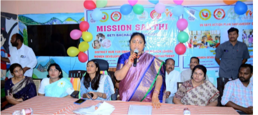
సంగారెడ్డి, ఏప్రిల్ 09, మన మహాత్తి న్యూస్ :