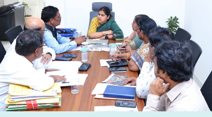
వరంగల్, 16 ఏప్రిల్ 2026