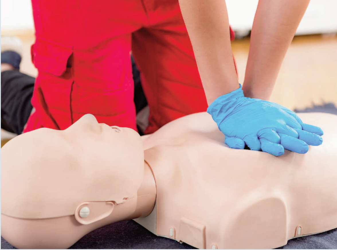
బాధితులు ఎక్కువ కాలం పాటు జీవించి ఉండే అవకాశాలు పెరుగుతాయి. అయితే సీపీఆర్ ఎలా చేయాలనే వివరాలను వైద్యులు వెల్లడిస్తున్నారు.

గుండె పోటు వచ్చిన వారికి వెంటనే సీపీఆర్ చేస్తే వారు జీవించే అవకాశాలు గణనీయంగా పెరుగుతాయని డాక్టర్లు సూచిస్తున్నారు. అయితే చాలా మందికి సీపీఆర్ పై అవగాహన లేదు. అనేక మందికి అసలు సీపీఆర్ అంటేనే తెలియదు. ఈ క్రమంలోనే సీపీఆర్ పై ప్రజల్లో అవగాహన పెరగాలని వారు అంటున్నారు. సీపీఆర్ అంటే Cardio Pulmonary Resuscitation (CPR) అని పూర్తి అర్థం వస్తుంది. గుండె పోటు వచ్చిన వారికి సీపీఆర్ చేస్తే గుండె కండరాలకు జరిగే నష్టం చాలా వరకు నివారించబడుతుంది. ఈ క్రమంలో వారిని సకాలంలో హాస్పిటల్ లో చేర్పించి చికిత్స అందిస్తే చాలా వరకు నష్టం నుంచి తప్పించుకోవచ్చు. దీని వల్ల గుండెకు ఎలాంటి హాని జరగదు. దీర్ఘకాలంలోనూ గుండెకు ఎలాంటి ముప్పు వాటిల్లదు. అలాగే