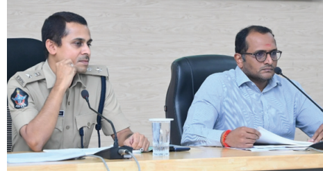
కాకినాడ (మనసులో మాట) ఏప్రిల్ 17.. యువత మాదక ద్రవ్యాల బారిన పడకుండా కాపాడేందుకు అన్ని పాఠశాలలు, కళాశాలల్లో ఈగల్ క్లబ్బులను చైతన్యవంతం చేయాలని జిల్లా కలెక్టర్ ఎం. ఎన్.హరేంద్ర ప్రసాద్