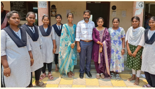
మలబార్ గోల్డ్ అండ్ డైమండ్ ఆధ్వర్యంలో ప్రతిభ కనబరిచిన పేద విద్యార్థులకు