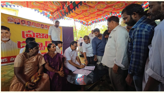
ప్రభుత్వాన్ని ప్రజలకు మరింత దగ్గర చేసే కార్యక్రమమే