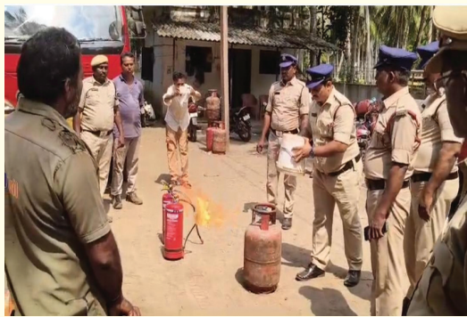
అగ్ని ప్రమాదాల పట్ల