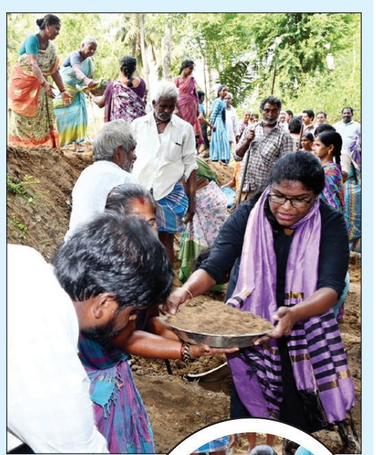
పాఠ చేతబట్టి మట్టిపూడికను తీసి, మట్టితట్టలను స్వయంగా ఉపాధిహామీ శ్రామికులకు అందించి అందరికీ జోష్ నింపిన జిల్లా కలెక్టరు కె.వెణ్కటేశ్వర్లు