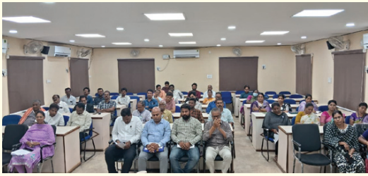
అందరికీ సమాన న్యాయం అందించడమే