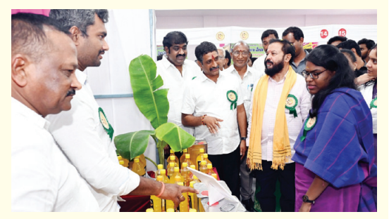
రాష్ట్రంలోనే తొలిసారిగా ఏలూరులో సీనియర్ ఆహార ఉత్పత్తులు మెగా మేళా ఏర్పాటు

రైతులకు శుభవార్త - సీనియర్ ఆహార అలవాట్లను చేసుకుని మనమంతా ఆరోగ్యాన్ని కాపాడుకుంటూ, పక్కతి వ్యవసాయ రైతులకు అండగా నిలవాలి - 80 మంది ఆర్గానిక్ వ్యవసాయ ఉత్పత్తి రైతులు, 180 వివిధ రకాలు ఉత్పత్తులు, 50 స్టాల్స్ ఏర్పాటు. - సీనియర్ ఆహార ఉత్పత్తులు తొలిరోజు మెగా మేళాను జిల్లా కలెక్టరు కె.వెణ్కటేశ్వర్లు లాంఛనంగా ప్రారంభించారు - జిల్లా కలెక్టరుతో పాటు దెందులూరు ఎమ్మెల్యే చింతమనేని ప్రభాకర్, ఉంగుటూరు ఎమ్మెల్యే పత్తమట్ల ధర్మరాజు, డిసియంయస్ చైర్మన్ చాగంటి మురళీకృష్ణ మిగతా 2