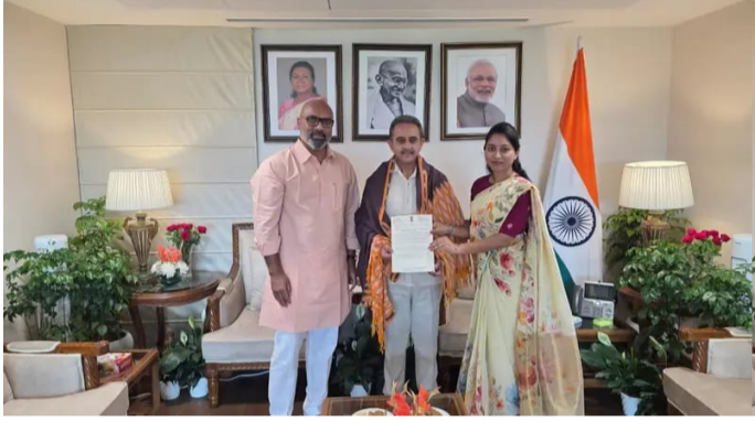
జగిత్యాల అమృత తెలంగాణ ఏప్రిల్ 18: జిల్లాలో పోస్ట్ ఆఫీస్ పాస్పార్ట్ సేవా కేంద్రం ఏర్పాటు దిశగా కీలక ముందడుగు వడింది. శనివారం నిజామాబాద్ పార్లమెంట్ సభ్యులు అరవింద్ ధర్మపురి తో కలిసి, కేంద్ర విదేశీ వ్యవహారాల శాఖ సహాయ మంత్రి కిరీ వర్తన్ సింగ్ ని న్యూ ఢిల్లీలోని వారి కార్యాలయంలో కలిశారు.