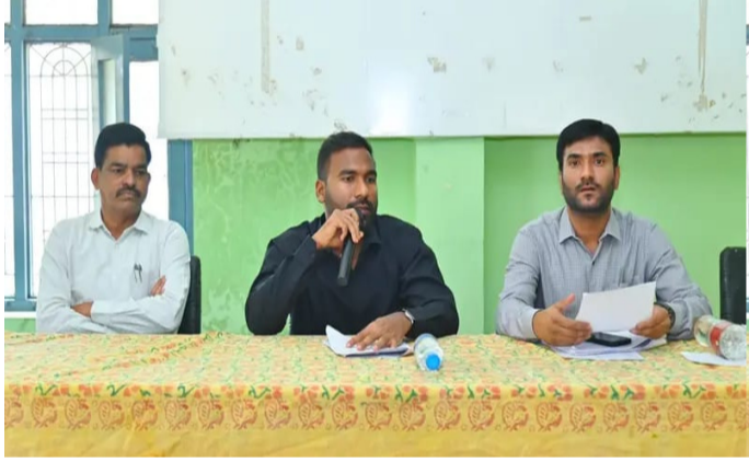
మల్లాపూర్ అమృత తెలంగాణ ఏప్రిల్ 18: జగిత్యాల జిల్లా మల్లాపూర్ మండల కేంద్రంలో ఉపాధి హామీ పథకం పనుల పురోగతిపై జిల్లా కలెక్టర్ బి.నత్యప్రసాద్ శనివారం సందర్శించి అధికారులతో సమీక్ష సమావేశం నిర్వహించారు. ఉపాధి హామీ పనులలో కూలీల సంఖ్య పెంపుపై ప్రత్యేకంగా చర్చించారు. గ్రామాల్లో మరిన్ని కూలీలను ఉపాధి హామీ పనుల్లో భాగస్వామ్యం చేయాలని సూచించారు. ప్రతి గ్రామంలో పనుల అందుబాటును పెంచాలని ఆదేశించారు.

ఆదేశించారు. పనుల ఎంపికలో పారదర్శకత పాటించాలని తెలిపారు. అర్హులైన ప్రతి కుటుంబానికి ఉపాధి అవకాశాలు కల్పించాలని చెప్పారు. పనుల ప్రగతిని రోజువారీగా పర్యవేక్షించాలని అన్నారు. కూలీల హాజరు నమోదు సక్రమంగా నిర్వహించాలని ఆదేశించారు. మున్ఫర్ రోడ్స్ లో ఎటువంటి లోపాలు ఉండకూడదని స్పష్టం చేశారు. కూలీలకు సమయానికి వేతనాలు చెల్లించేలా చర్యలు తీసుకోవాలని తెలిపారు. పనుల తీరుపై ప్రత్యేక శ్రద్ధ పెట్టాలని సూచించారు. ఉపాధి హామీ పనులలో మహిళలను భాగస్వామ్యం చేయాలని తెలిపారు. ప్రతి పనిని ఫోటో క్యాప్చర్ గా ద్వారా ఎస్ యం యం ఎస్ యామ్ లో నమోదు చేయాలని చెప్పారు. జియో ట్యాగింగ్ విధానాన్ని కచ్చితంగా అమలు చేయాలని ఆదేశించారు