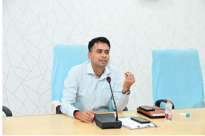
సమావేశంలో మాట్లాడుతున్న అదిలాబాద్ జిల్లా ఎస్పీ అఖిల్ మహాజన్

జిల్లాలో సైబర్ క్రైమ్ జరగకుండా సమిష్టి కృషితో పనిచేయాలి ప్రజల ఆర్థిక రక్షణకై, నేరాల నియంత్రణకు కృషి చేద్దాం భద్రతా అంశాలలో ఎలాంటి జాప్యం వహించవద్దు మోషన్స్ సెన్సార్స్, సీసీటీవీ కెమెరాల పనితీరుపై సెల్స్ ఆడిట్ చేసుకోవాలి జిల్లాలోని అన్ని జాతీయ బ్యాంకు మేనేజర్లు, అధికారులతో సమావేశం : జిల్లా ఎస్పీ అఖిల్ మహాజన్