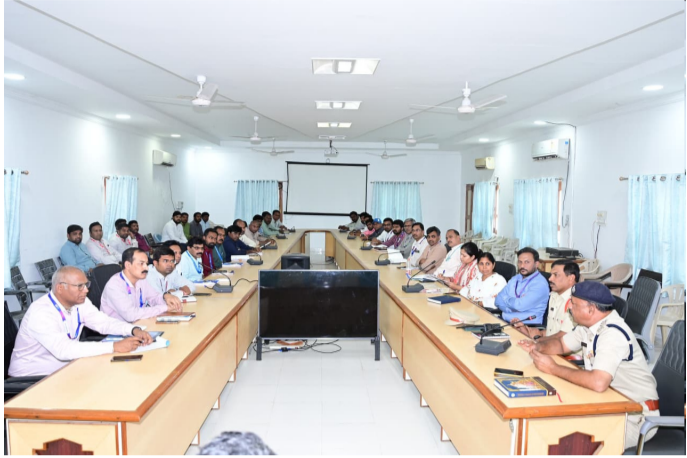
హాజరైన వివిధ బ్యాంకు మేనేజర్ దృశ్యం