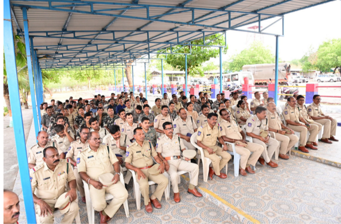
పాల్గొన్న పోలీస్ అధికారులు