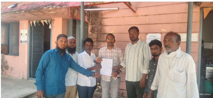
సర్పంచర్ జి ఎంపీడికి కార్యాలయంలో ఎంపీడి కు వినతి పత్రం అందజేసిన దృశ్యం