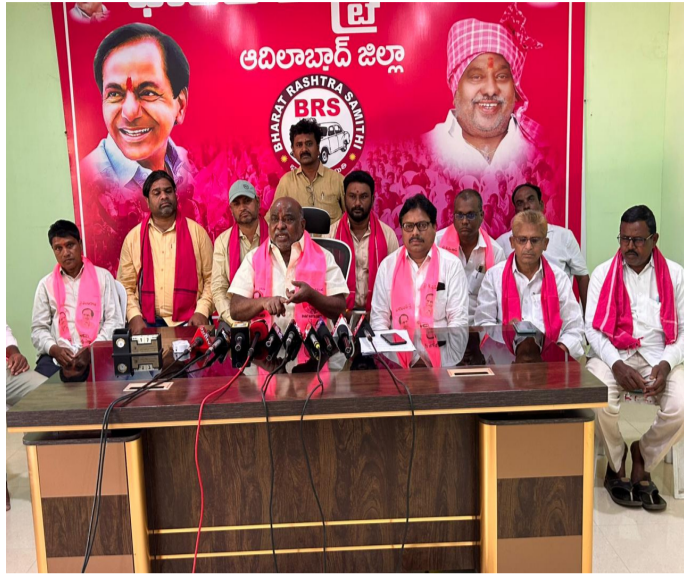
మీడియా సమావేశంలో మాట్లాడుతున్న మాజీ మంత్రి జోగు రామన్న

కేంద్ర రాష్ట్ర ప్రభుత్వాలు పునర్విభజన, సమగ్ర కుటుంబ సర్వే పేరుతో బీసీలకు తీవ్ర అన్యాయం చేస్తున్నాయని మాజీ మంత్రి బి.ఆర్.ఎస్.పార్టీ అధ్యక్షులు జోగురామన్న