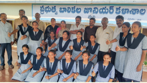
తుని ప్రభుత్వ బాలికల జూనియర్ కళాశాల