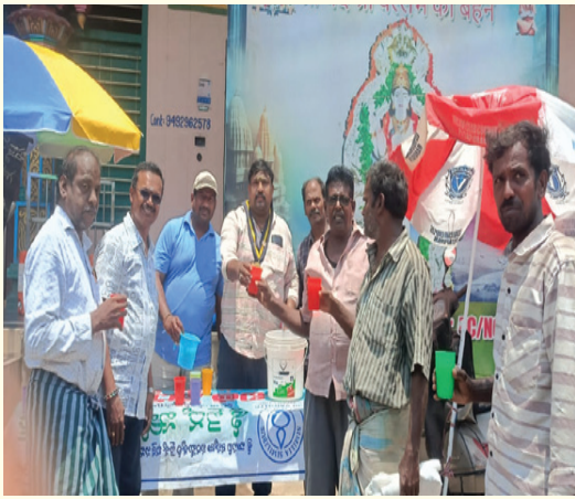
బాటసారుల దాహార్తిని తీరుస్తున్న