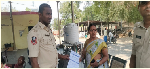
అగ్ని ప్రమాదాలకు అవగాహన నిర్వహించిన