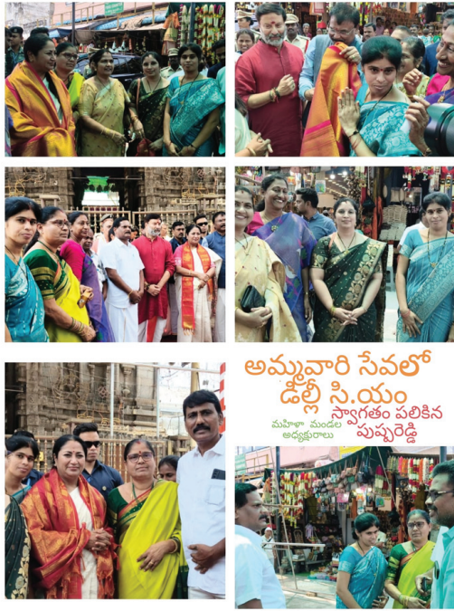
అమ్మవారి సేవలో డిల్లీ సి.యం మహిళా మండల అధ్యక్షురాలు