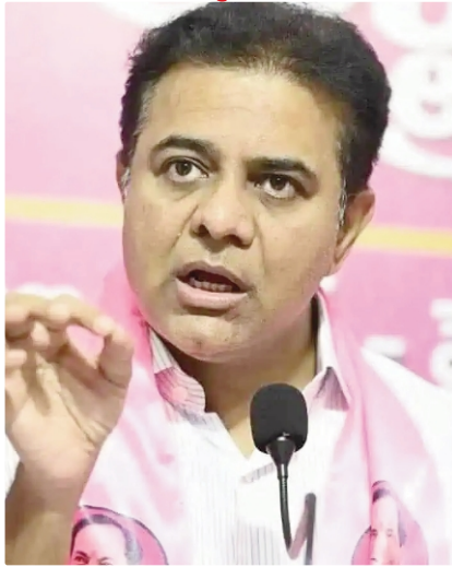
కట్టుబడి ఉన్నామని పునరుద్ఘాటించారు.