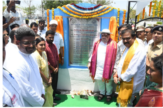
అమృత తెలంగాణ ఆదిలాబాద్ న్యూస్ రహదారి నిబంధనలపై అవగాహన అనేది చిన్ననాటి నుంచే అలవదాలని, అప్పుడే భవిష్యత్లో బాధ్యతాయుతమైన పౌరులుగా ఎదుగుతారని రాష్ట్ర రవాణా శాఖ మంత్రి పాస్ పుభాకర్ పేర్కొన్నారు.