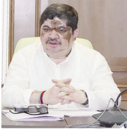
అంశంపై కమిటీ అధ్యయనం చేస్తోందని వివరించారు.