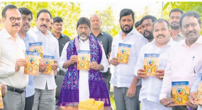
పాఠ్యాంశాలు, ప్రాఫెషనల్స్, మేధావులు, విద్యార్థుల జాయింట్ యాక్షన్ కమిటీ, అలిండియా ఓబీసీ స్టూడెంట్స్ అసోసియేషన్ ప్రతినిధులతో భేటీ అయ్యారు.