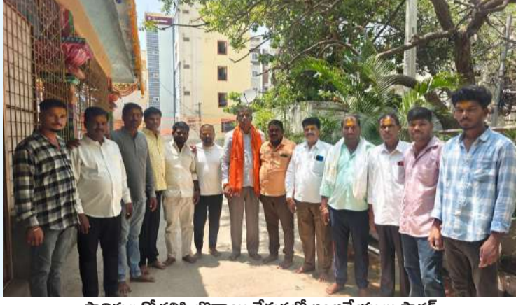
స్థానికులతో కలిసి బోధాయ వేడుకల్లో ఆంజనేయులు సాగర్