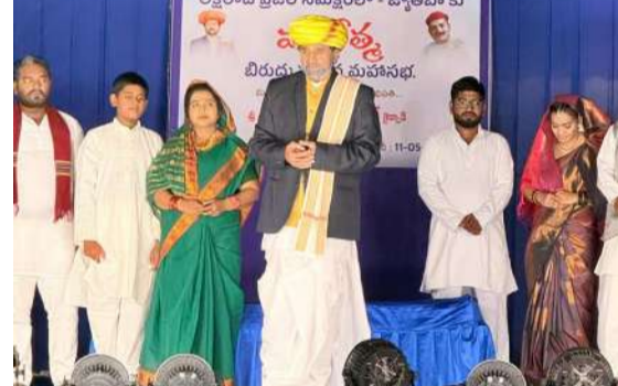
తెలంగాణలో మహాత్మా జ్యోతిరావ్ పూలే నాటికను ప్రదర్శిస్తున్న సినిమార్ కల్చరల్ ట్రాస్ట్