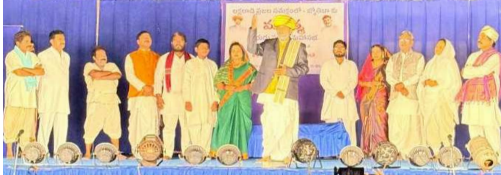
తెలంగాణలో మహాత్మా జ్యోతిరావ్ పూలే నాటికను ప్రదర్శిస్తున్న సినిమార్ కల్చరల్ ట్రాస్ట్