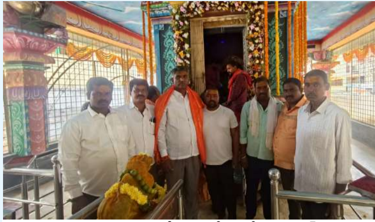
పోచమ్మ అమ్మవారి ప్రత్యేక పూజల్లో ఆంజనేయులు సాగర్