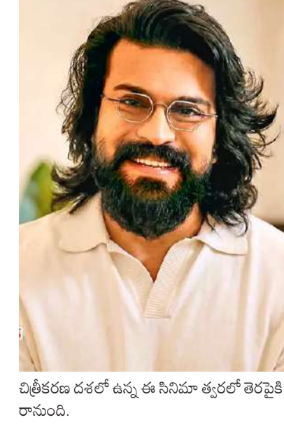
చిత్రకథ దశరథ్ ఉన్న ఈ సినిమా త్వరలో తెరపైకి రానుంది.

ప్రేక్షకులకు కొత్తదనం పంచిచ్చేందుకు సినీకారలం కొత్త దారులు వెతుక్కుంటున్నారు. రచన, దర్శకత్వం, నిర్మాణం.. ఇలా తమలోని కొత్త కోణాల్ని ఆవిష్కరించే ప్రయత్నం చేస్తున్నారు. బహుముఖ ప్రజ్ఞతో సినీప్రియుల్ని మెప్పించేందుకు ప్రయత్నిస్తున్నారు. మరి త్వరలో కొత్త అవకాశాల్లో తెరపై అలరించుకున్న ఆ కారణాలే? ఆ చిత్ర విశేషాలే? రామ్ చరణ్ నటనకే పరిమితం కాకుండా నిర్మాత గానూ ఇప్పటికే ప్రేక్షకుల్ని మెప్పించారు. కొజిడెల ప్రొడక్షన్ కంపెనీని ప్రారంభించింది. తన తండ్రితో 'ఛై ది నెం. 150', 'సైరా నరసింహారెడ్డి', 'గాడ్ ఫాదర్' లాంటి విజయవంతమైన చిత్రాల్ని నిర్మించారు. అయితే ఇప్పుడాయన తొలిసారి ఓ బయటి హీరో సినిమా కోసం సమర్థకుడిగా మారారు. ప్రస్తుతం నిఖిల్ హీరోగా రామ్ వంటి కృష్ణ దర్శకత్వంలో రూపొందుతున్న పాన్ ఇండియా చిత్రం 'ది ఇండియా హాస్'.. యూవీ ట్రియోవన్న నిర్మిస్తున్న ఈ సినిమాకి చరణ్ సమర్థకుడిగా వ్యవహరిస్తున్నారు. సామాజిక త్రాగినీ ఛార్జం జరిగిన వాస్తవ సంఘటనలతో పీ రియూడిక్ యాక్టర్ ప్రబుల్ దీన్ని తెరకెక్కిస్తున్నారు.