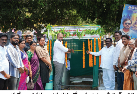
రాజమహేంద్రవరం (మనసులో మాట), ఏప్రిల్ 12: మండు వేసవిలో ప్రజల దాహార్తిని తీర్చేందుకు

- బాటసారుల దాహార్తి తీర్చేందుకే చలి వేంద్రాలు - ఎమ్మెల్యే ఆదిరెడ్డి శ్రీనివాస్