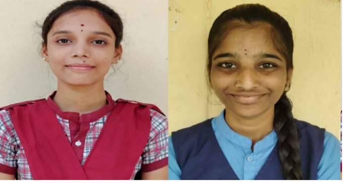
అమృత్ తెలంగాణ: తెలంగాణ ప్రభుత్వం ఆదివారం విడుదల చేసిన ఇంటర్మీడియట్ ఫలితాల్లో మండలంలోని ఎడపల్లి మోడల్ స్కూల్లో ప్రథమ సంవత్సరంలో మొత్తం విద్యార్థులు 58 పరీక్షకు హాజరు కాగా 52 మంది ఉ