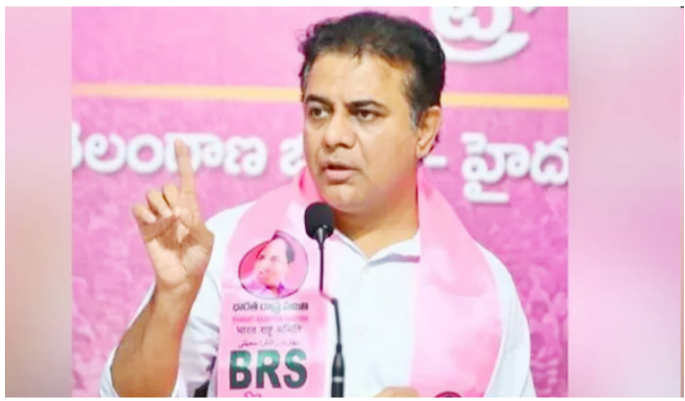
వఅద్దలను కూడా కాంగ్రెస్ ప్రభుత్వం మోసగించిందన్నారు. గడిచిన 28 నెలల్లో తెలంగాణ రాష్ట్రంలో కాంగ్రెస్ చేసిన అభివృద్ధి ఏమీ లేదు అని కెటిఆర్ ధ్వజమెత్తారు.

ఇబ్రహీంపట్నం (తెలంగాణ) : అమృత్ తెలంగాణ: తెలంగాణ రాష్ట్రంలో ప్రస్తుత పరిస్థితుల్లో మంచి పాలన అందించాలని అవసరమందని బిఆర్ఎస్ కార్యనిర్వాహక అధ్యక్షుడు కెటిఆర్ అన్నారు. రానున్న ఎన్నికల్లో అధికారంలోకి వచ్చేది బిఆర్ఎస్ ప్రభుత్వమేనని ధీమా వ్యక్తం చేశారు. హైదరాబాద్‌లోని ఇబ్రహీంపట్నంలో సూతంపాటి ఎన్నికైన సర్పంచులు, కోన్సిలర్లకు సన్మాన కార్యక్రమం నిర్వహించారు. ఈ సందర్భంగా కెటిఆర్ మాట్లాడుతూ.. రాష్ట్రంలో ఇంతవరకు రైతులకు రుణమాఫీ దబ్బులు ఇవ్వలేదన్నారు. ఆరు గ్యారంటీల పేరుతో అధికారంలోకి వచ్చిన కాంగ్రెస్.. వాటిని ఎంత వరకు అమలు చేసినదని ప్రశ్నించారు. సిఎం రేవంత్ రెడ్డి ఢిల్లీకి ఎన్నిసార్లు వెళ్లారో.. ఎందుకు వెళుతున్నారో ప్రజలకు తెలుసుసన్నారు. కాంగ్రెస్ ప్రభుత్వ అరాచకాలు అన్నీ ఇన్నీ కాదు అని చెప్పారు. యువతకు 2 లక్షల ఉద్యోగాలు ఇస్తానని ఊరించి.. గడ్డెక్కె గడిచిన రెండున్నరేళ్లలో 11 వేల ఉద్యోగాలు కూడా ఇవ్వలేదు అని తెలిపారు. స్కూటీలు, నెలకు రూ. 2,500 ఇస్తామని చెప్పి మహిళలను కూడా మోసం చేశారని ఆరోపించారు. రెండు నెలల పింఛను ఇవ్వకుండా