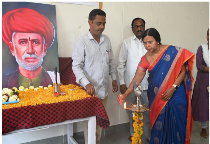
మహాత్మ జ్యోతిబాఫూలే చిత్రపటానికి నివాళులు అర్పిస్తున్న ఆర్డీవో