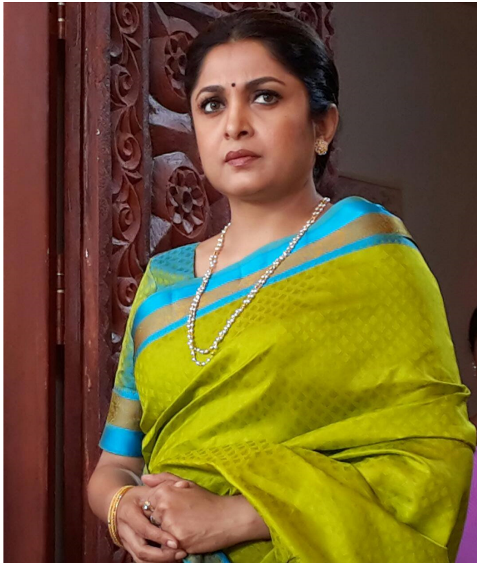
రూపొందుతున్నట్లు సమాచారం. వచ్చే ఏడాది వేసవిలో ప్రేక్షకుల ముందుకు తీసుకురావాలని యోచిస్తున్నారు.

అల్లు అర్జున్ నటిస్తున్న 'రాకా' చిత్రం ప్రస్తుతం సినీ రంగంలో సంచలనంగా మారింది. దర్శకుడు అల్లీ రూపొందిస్తున్న ఈ చిత్రానికి సంబంధించిన ఫస్ట్ లుక్ విడుదల కావడంతోనే భారీ చర్చ మొదలైంది. విడుదలైన ఫస్ట్ లుక్ లో అల్లు అర్జున్ పూర్తిగా కొత్తగా కనిపించారు. ముందు గుండు, వెనుక కొద్దిగా జుట్టుతో, ముఖాన్ని చేతులతో కప్పకున్న తీరు భయానకంగా, రహస్యంగా ఉంది. నగం మనిషి, నగం తోడేలు స్వరూపంలో కనిపించనున్నట్టు ఈ చిత్రం సూచిస్తోంది. ఈ చిత్రంలో దీపిక పదుకొణెలి ప్రధాన కథానాయికగా నటిస్తోంది. ఆమె పాత్ర యోధురాలిగా ఉంటుందని సమాచారం. మరోవైపు రమ్యకృష్ణ కూడా కీలక పాత్రలో కనిపించనుందనే వార్తలు వినిపిస్తున్నాయి. అల్లు అర్జున్ ఫస్ట్ లుక్ పై స్పందించిన రమ్యకృష్ణ.. 'పరిధులను దాటి వెళ్లే అనుభవానికి సిద్ధంగా ఉండండి' అని చెప్పడం ఆమె పాత్రపై మరింత ఆసక్తిని పెంచింది. ఈ చిత్రంలో అల్లు అర్జున్ రెండు పాత్రల్లో కనిపించనున్నారని వార్తలు వినిపిస్తున్నాయి. ఒకటి నాయక పాత్ర కాగా, మరొకటి ప్రతినాయక స్వభావం కలిగిన పాత్రగా ఉంటుందని సమాచారం. ప్రస్తుతం విడుదలైన రూపం ప్రతినాయక పాత్రదేసిన చెబుతున్నారు. ఈ చిత్రంలో ఒకరి కంటే ఎక్కువ కథానాయికలు ఉండొచ్చని ప్రచారం జరుగుతోంది. సమంత రూత్ ప్రభు, రమ్యకృష్ణ మంధాన పేర్లు వినిపిస్తున్నప్పటికీ దీనిపై ఇంకా అధికారిక ప్రకటన లేదు. ఇక 'రాకా' అనే పదానికి రాక్షసుడు, పౌర్ణమి చంద్రుడు వంటి అర్థాలున్నాయి. ఈ చిత్రంలో నాయకుడి లోపల ఉన్న బీకటి, విద్యుత్ శక్తిని చూపించేలా ఈ పేరును ఎంపిక చేసినట్లు తెలుస్తోంది. ఈ చిత్రాన్ని అత్యంత భారీ వ్యయంతో నిర్మిస్తున్నారు. విజ్ఞానకథాంశం, అసాధారణ శక్తుల నేపథ్యంతో ఈ చిత్రం