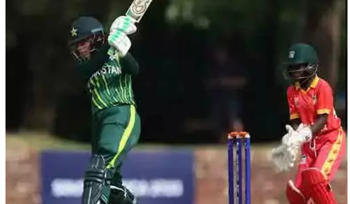
భాగంగా జరుగుతుంది.. టి-20 సిరీస్ సాధారణంగా సిరీస్ గా పరిగణించబడుతుంది. అన్ని మ్యాచ్ లు కరాచీ నేషనల్ బ్యాంక్ స్టేడియంలో జరుగుతాయి.

ఇస్లామాబాద్: పాకిస్తాన్ క్రికెట్ చరిత్రలో తొలిసారిగా ఓ అద్భుత ఘటన చోటు చేసుకోనుంది. తొలిసారిగా పాకిస్తాన్ మహిళల ట్వెన్ ట్వెంటీ సిరీస్ జరుగుతుంది. జింబాబ్వే మహిళల జట్టు పాకిస్తాన్ లో పర్యటించనుంది. ఇరు జట్ల మధ్య మూడు వన్డేలు, టి20 సిరీస్ మహిళల క్రికెట్ అభివృద్ధిలో కీలక ఘట్టంగా నిలవనుంది. ఈ సిరీస్ మ్యాచ్ లు మే 3 నుంచి 15 వరకూ మధ్య తేదీల్లో జరుగుతాయి. వన్? సిరీస్ ఐసీసీ మహిళల ఛాంపియన్ షిప్-2025-29లో