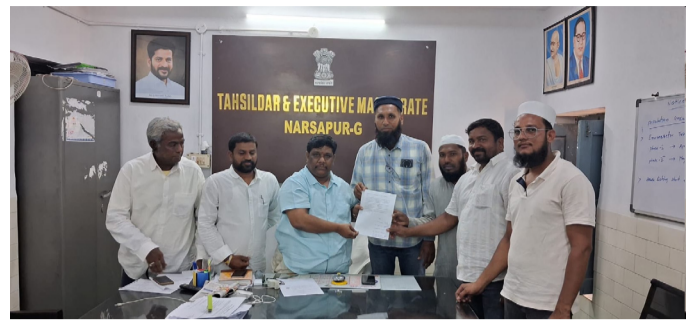
తాసిల్దార్ కు వినతి పత్రం అందజేస్తున్న ఆర్థిక సామాజిక కార్యకర్తలు