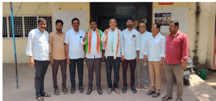
మున్సిపల్ కార్యాలయం ముందు కాంగ్రెస్ కౌన్సిలర్లు

నిర్మల్ జిల్లా ఏప్రిల్ 10 అమృత్ తెలంగాణ నిర్మల్ పట్టణం అమృత్ 2 లోను ఎమ్మెల్యే ప్రమేయం లేదు.. రాష్ట్రంలోని అన్ని మున్సిపాలిటీలకు ముఖ్యమంత్రి నిధులు కేటాయించారు. బీజేపీ ధర్మాను ఖండించిన కాంగ్రెస్ కౌన్సిలర్లు నిర్మల్ మున్సిపల్ కార్యాలయం ముందు బీజేపీ నాయకులు ధర్మా చేయడం హాస్యాస్పదంగా ఉందని, తమ ఉనికి కాపాడుకునేందుకే ధర్మా చేపట్టారని కాంగ్రెస్ పార్టీ కౌన్సిలర్ లు అన్నారు. విలేజ్ కు సమావేశంలో మాట్లాడుతూ ముఖ్యమంత్రి కేటాయించిన 15 కోట్ల ప్రత్యేక నిధులపై బీజేపీ ఆరోపణలు హాస్యాస్పదంగా ఉందన్నారు. ఈ నిధులు ఎమ్మెల్యే చోరువతో మంజూరు కాలేదని ఈ నిధులు రాష్ట్రంలోని అన్ని మున్సిపాలిటీలకు ముఖ్యమంత్రి రేవంత్ రెడ్డి కేటాయించడం జరిగిందని పేర్కొన్నారు. గతంలో వార్షిక సమస్యలపై అవగాహన లేకుండా కేటాయించారు. అందుకు కొత్త