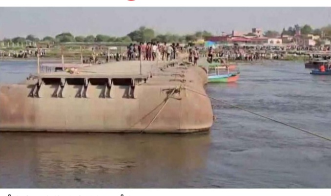
చేరుకుని సహాయక చర్యలు చేపట్టాయి.

హైదరాబాద్: అమృత్ తెలంగాణ: ఉత్తరప్రదేశ్ లోని మధురలో గల బృందావన్ సమీపంలో శుక్రవారం ఘోర పడవ ప్రమాదం చోటుచేసుకుంది. యమునా నదిలోని కేసీఘాట్ వద్ద సుమారు 25 నుంచి 30 మంది భక్తులతో వెళ్తున్న పడవ అకస్మాత్తుగా బోల్తా పడింది. ఈ విషయం ఘటనలో ఇప్పటివరకు తొమ్మిది మంది మరణించగా, మరికొందరు గల్లంతైతే సమాచారం. ప్రమాద సమయంలో నీటిలో మునిగిపోతున్న 14 మందిని రెస్క్యూ టీమ్స్ సురక్షితంగా బయటకు తీశాయి. అయితే, మరో 10 నుంచి 12 మంది వరకు నీటిలో గల్లంతై ఉంటారని అంచనా వేస్తున్నారు. జిల్లా అధికారుల కథనం ప్రకారం.. పంజాబ్ నుంచి వచ్చిన యాత్రికుల బృందం యమునా నదిలో ప్రయాణిస్తుండగా ఈ ప్రమాదం జరిగింది. పడవలో సామర్వానికి మించి ప్రయాణికులు ఉండటమే కారణం.. బృందావన్ వద్ద ఉన్న పాంటూన్ వంతెన సమీపంలో పడవ నియంత్రణ కోల్పోయి బోల్తా పడింది. ప్రమాదం జరిగిన వెంటనే స్థానికులు, పోలీసులు మరియు విపత్తు నిర్వహణ బృందాలు ఘటనా స్థలానికి