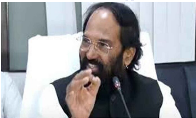
భారత ప్రభుత్వం తరపున వరిని సేకరిస్తోందని గుర్తు చేశారు. అయితే, కస్టమ్ మిల్స్ రైన్, ఉడకబెట్టిన బియ్యం లక్ష్యాలను తగ్గించాలన్న కేంద్ర నిర్ణయంతో తెలంగాణ అదనపు నిల్వలు, నిల్వ ఖర్చులు, మిల్లింగ్ ఖర్చులు, వడ్డీ బాధ్యతలతో సతమతమవుతోందని గుర్తు చేశారు. లక్షలాది మంది రైతులను కాపాడేందుకు సేకరణ కొనసాగించాలని ఆయన విజ్ఞప్తి చేశారు.

హైదరాబాద్ : అమృత్ తెలంగాణ: రాష్ట్రంలో పెరుగుతున్న వరి ఉత్పత్తి, కేంద్రం కేటాయింపును ధాన్యం సేకరణకు మధ్య నెలకొన్న వ్యత్యాసాన్ని తగ్గించాలని రాష్ట్ర నీటిపారుదల, పౌర సరఫరాల శాఖ మంత్రి ఎస్. ఉత్తమ్ కుమార్ రెడ్డి కేంద్ర ప్రభుత్వాన్ని కోరారు. ఈమేరకు గురువారం ఆయన కేంద్ర మంత్రి ప్రహ్లాద్ జోషికి డిమాండ్ తో కూడిన లేఖ రాశారు. రైతులు నష్టానికి లోనుకాకుండా కాపాడుతూనే, అదనపు నిల్వలను నిర్వహించడంలో తాము ఎదుర్కొంటున్న ఇబ్బందులను తొలగించాలని కోరారు. ఎఫ్ సీఐ ముడి బియ్యం లక్ష్యాన్ని తగ్గించిందిని పేర్కొన్నారు. రబీ సీజన్ కు బదులు లక్షల మెట్రిక్ టన్నుల బియ్యాన్ని ఉడికించేందుకు అవకాశం కల్పించాలని విజ్ఞప్తి చేశారు. ప్రస్తుతం 8.45 లక్షల మెట్రిక్ టన్నుల బియ్యం ఇంకా సరఫరా కావాల్సి ఉందని పేర్కొన్నారు. దీని గడువు ఈ ఏడాది పిల్లవరితో ముగిసిపోయిందని తెలిపారు. తేమ స్థాయి తక్కువగా ఉన్న దానిని ఉడకబెట్టిన బియ్యంగా మార్చేందుకు కేంద్రం అవకాశం కల్పించాలని పేర్కొన్నారు. రైన్ మిల్లర్లు కేవలం బదులు శాతం మాత్రమే సరఫరా చేసేందుకు సూత్రప్రాయంగా అంగీకరించారని, దాన్ని ఆచరణలో పెట్టాలని సూచించారు. డిసెంబర్ 2023లో అధికారంలోకి వచ్చిన కాంగ్రెస్ ప్రభుత్వం, ఖరీఫ్, రబీ సీజన్, జనవరిలోనూ వరి ఉత్పత్తిలో గణనీయంగా పెరిగిందని తెలిపారు. రైతులకు కనీస మద్దతు ధర అందించడం, నష్టానికి అమ్మకోకుండా నివారించేందుకు వికేంద్రీకృత సేకరణ పథకం కింద