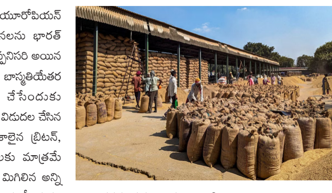
నిబంధనను సడలించినట్లు వెల్లడించింది.

న్యూఢిల్లీ : అమృత్ తెలంగాణ: కొన్ని యూరోపియన్ దేశాలకు బియ్యం ఎగుమతులపై నిబంధనలను భారత్ తాత్కాలికంగా సడలించింది. సాధారణంగా తప్పనిసరి అయిన నిపుణుల తనిఖీ దృవపత్రం లేకుండానే బియ్యం, బియ్యం తయారీ బియ్యాన్ని ఆరు నెలలపాటు ఎగుమతి చేసేందుకు అనుమతించినట్లు కేంద్ర ప్రభుత్వం శుక్రవారం విడుదల చేసిన ఒక ప్రకటనలో తెలిపింది. ఇయ సభ్యదేశాలైన బ్రిటన్, ఐస్లాండ్, లెక్సెన్స్టెన్, నార్వే, స్వీట్జర్లాండ్లకు మాత్రమే ధృవీకరణ పత్రం తప్పనిసరి అని పేర్కొంది. మిగిలిన అన్ని యూరోపియన్ దేశాలకు ఆరు నెలల పాటు తనిఖీ పత్రం