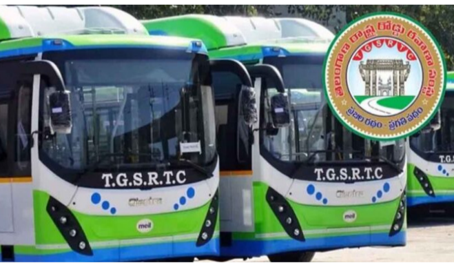
బ్యాంకులో వేతన ఖాతా ఉన్న సింగరేణి సంస్థ ఉద్యోగుల సహజ మరణానికి రూ. 10 లక్షల బీమా సౌకర్యం కల్పించిన దానికి అనుగుణంగా ఆర్టీసీ ఉద్యోగులకు కూడా బీమా సౌకర్యం కల్పించాలని డిఎస్ఆర్టీసీ స్టాఫ్ అండ్ చర్చర్స్ ఫెడరేషన్ వినతి పత్రం సమర్పించినట్లు తెలియజేశారు. ఈ బీమా సౌకర్యం ఈనెల ఒకటి నుంచే అమల్లోకి వచ్చినట్లుగా ఉత్తర్వులు జారీ చేయడం పట్ల ఆర్టీసీ యాజమాన్యానికి కృతజ్ఞతలు తెలియజేశారు.