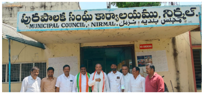
పాలకవర్గం ఆ టెండర్లను రద్దుచేసి, వార్డు అవసరాన్ని బట్టి కేటాయించాలని నిర్ణయించినట్లు.

నిర్మల్ జిల్లా ఏప్రిల్ 10 అమృత్ తెలంగాణ నిర్మల్ పట్టణం అమృత్ 2 లోను ఎమ్మెల్యే ప్రమేయం లేదు.. రాష్ట్రంలోని అన్ని మున్సిపాలిటీలకు ముఖ్యమంత్రి నిధులు కేటాయించారు. బీజేపీ ధర్మాను ఖండించిన కాంగ్రెస్ కౌన్సిలర్లు నిర్మల్ మున్సిపల్ కార్యాలయం ముందు బీజేపీ నాయకులు ధర్మా చేయడం హాస్యాస్పదంగా ఉందని, తమ ఉనికి కాపాడుకునేందుకే ధర్మా చేపట్టారని కాంగ్రెస్ పార్టీ కౌన్సిలర్ లు అన్నారు. విలేజ్ కు సమావేశంలో మాట్లాడుతూ ముఖ్యమంత్రి కేటాయించిన 15 కోట్ల ప్రత్యేక నిధులపై బీజేపీ ఆరోపణలు హాస్యాస్పదంగా ఉందన్నారు. ఈ నిధులు ఎమ్మెల్యే చోరువతో మంజూరు కాలేదని ఈ నిధులు రాష్ట్రంలోని అన్ని మున్సిపాలిటీలకు ముఖ్యమంత్రి రేవంత్ రెడ్డి కేటాయించడం జరిగిందని పేర్కొన్నారు. గతంలో వార్షిక సమస్యలపై అవగాహన లేకుండా కేటాయించారు. అందుకు కొత్త